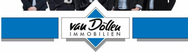
Team van Döllen Immobilien